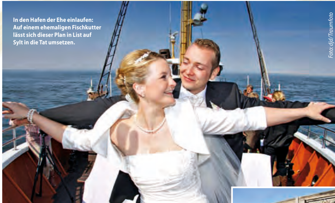
In den Hafen der Ehe einlaufen: Auf einem ehemaligen Fischkutter lässt sich dieser Plan in List auf Sylt in die Tat umsetzen.

(djd). Viele Inselurlauber verlieben sich auf Anhieb in die Natur und den besonderen Flair von Deutschlands nördlichster Insel Sylt. Das Eiland ist gleichermaßen ein beliebtes Ziel für alle, die ihre Liebe zueinander zelebrieren möchten. Das am Lister Hafen aufgestellte metallene Herz wurde schnell zum Lieblingstreffpunkt für Paare, die sich hier mit einem Liebeschloss verewigen können. Natürlich darf auch ein Kuss-Selfie mit direktem Blick auf die Nordsee nicht fehlen. Die Nachfrage war so groß, dass das Herz inzwischen um den Schriftzug "Love" ergänzt wurde.