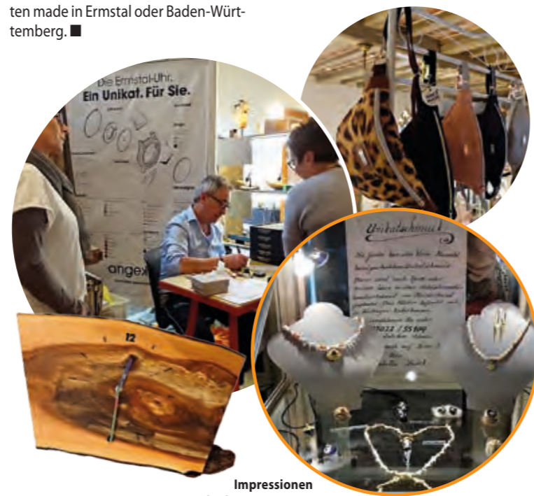
Impressionen Markt der Künste 2019

Bis auf das Uhrwerk sind alle Zutaten made in Ermstal oder Baden-Württemberg. ■