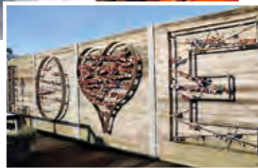
Aus dem Liebesherz ist das Wort „Love“ geworden. Viele Paare verewigen sich im Lister Hafen mit einem Liebeschloss.

Fischkutter ist ein Ausflugsboot geworden, das sich auch für Hochzeiten chartern lässt. Bis zu 50 Gäste können die standesamtliche Trauung im maritimen Stil auf dem 25 Meter langen Kutter begleiten. Wer für den schönsten Tag im Leben festen Boden unter den Füßen statt schwankender Schiffsplanken bevorzugt, findet in